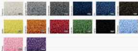
Tabella colori standard

Invita massimamente degli spessori d'intarsio 1 cm