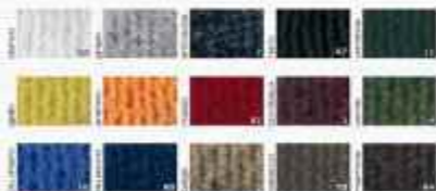
Tabella colori standard